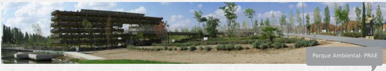
Parque Ambiental- PRAE