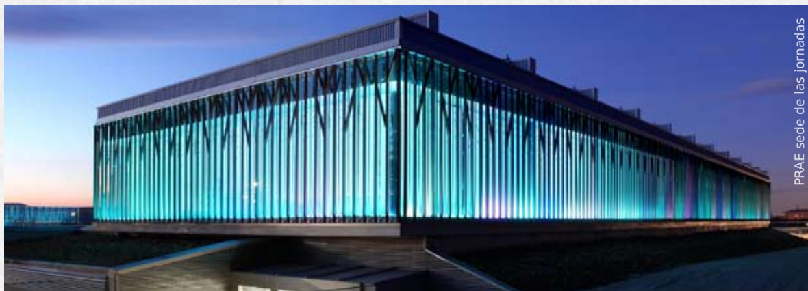
PRAE sede de las jornadas

26 de Abril - Martes y 27 de Abril - Miércoles